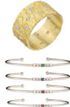
Bague Pleins Feux sur Toi, en or et diamants. Bracelets Capsule d'Émotions, en or rose et émeraude, saphir bleu, saphir rose ou saphir orange (de haut en bas).

240 diamants (29 500 euros) ou ces anneaux Pleins Feux sur Toi en or jaune, blanc ou rose martelé avec 18 diamants (5 500 euros). Production 100 % européenne Car, depuis qu'il a repris les rênes de la maison en 2001, Alain Némarg a toujours à cœur de rendre le bijou plus accessible. Dans ce large écriin de 80 mètres carrés, aux murs bleus nuit, seront également proposés tous les succès de la marque aux prix volontairement attractifs. Exemplaires à ce titre, la bague Chance of Love et son trèfle emblématique, orné en son cœur d'un diamant (895 euros). Ou les anneaux en or perlé Le Premier Jour (790 euros), déclinés aussi en pendentifs et boucles d'oreilles. À noter aussi la dernière ligne de bracelets ultrafins Capsule d'Émotions,