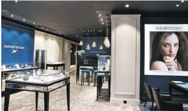
La nouvelle boutique du joaillier rue de Rivoli, à Paris.

ADRESSE Le joaillier, qui a signé le diadème de la princesse Marie de Danemark, vient d'inaugurer une boutique, rue de Rivoli, où il dévoile ses dernières créations.